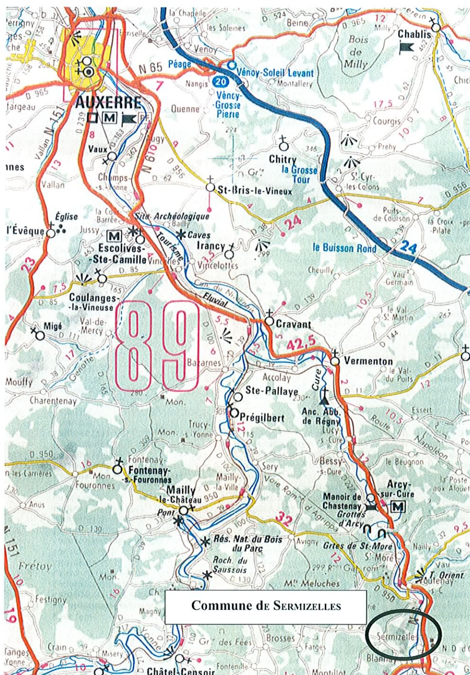
Figure 1 : Plan de situation (1/250 000 IGN « NIVERNAIS - BOURGOGNE »)

La commune de SERMIZELLES est située une dizaine de kilomètres au Nord-Ouest d'AVALLON, chef-lieu d'arrondissement, et à 35 km environ au Sud-Est d'AUXERRE. Son territoire, qui couvre une superficie de 701 hectares, se développe sur les deux rives de LA CURE, en aval de la confluence avec son principal affluent, LE COUSIN.